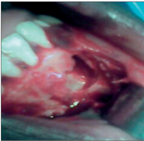
Fig. 2. Aspect de la cavité tumorale. Fig. 2. The tumor cavity.

prémédication d'usage. L'accès à la tumeur par un lambeau de pleine épaisseur a permis d'observer la lyse de la corticale osseuse externe. Avec le curetage de la tumeur, 19 dents miniatures ont été extraites (Figs. 2 et 3) ; la 33 dont la racine était coudée et bifide dans la région apicale, a été extraite. Au terme de l'intervention, les éléments de la tumeur ont été soumis à un examen anatomo-pathologique qui a confirmé le diagnostic d'odontome composé. Le suivi postopératoire a été planifié pour contrôler la néoformation osseuse et dépister une éventuelle récurrence.