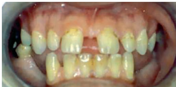
Figure 2 : Aspect de la denture avec occlusion antérieure : présence de diastèmes et d'hypoplasies de l'émail.

L'analyse des téléradiographies sagittale, axiale et frontale montre une classe III squelettique avec prognathisme ainsi qu'une brachymaxillie et un champ