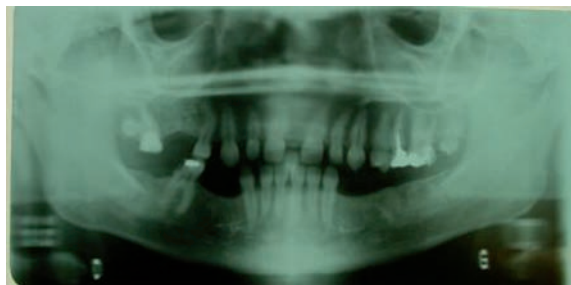
Figure 3 : Radiographie panoramique : édentation postérieure importante bilatérale, dents avec des racines courtes, et une chambre pulpaire large.

Dental aspect with anterior occlusion: presence of diastemas and hypoplasias of the enamel.