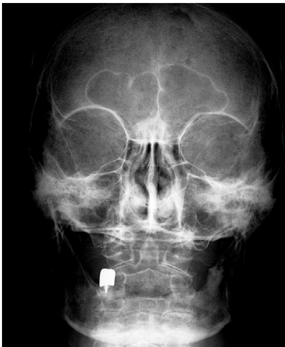
Figure 3 : Radiographie du crâne de face Fronto-cranio-facial X-ray

peut également être retrouvée [6]. Ces manifestations sont dues à la physiopathologie de l'atteinte myélomateuse elle-même. Dans le cas présenté, la prise d'une corticothérapie au long cours dans un but thérapeutique, l'âge avancé de la patiente et le sexe féminin, sont autant de facteurs qui majorent l'atteinte osseuse (Fig. 3 et 4). Dans le myélome multiple, l'ensemble du squelette osseux peut être atteint, en particulier la colonne vertébrale, le bassin, les côtes, le sternum, les clavicules, l'extrémité supérieure des humérus et des fémurs, ainsi que le crâne [6,7]. Dans la littérature, on retrouve de nombreux cas de manifestations osseuses myélomateuses touchant le maxillaire et surtout la mandibule [1,2,3,8,9,10,11,12,13]. Des fractures alvéolaires maxillaires ou mandibulaires, après avulsions dentaires, ont été rapportées. Le fragment osseux forme un séquestre qui s'individualise et s'élimine progressivement [1,4]. Dans le cas présenté, il n'y a pas eu d'avulsion récente, pouvant expliquer la formation de ce séquestre. Il s'agit probablement d'une fracture spontanée comme on peut en observer, en particulier sur le rachis. Elles ne sont que très rarement rapportées dans la sphère maxillo-faciale. La formation du séquestre osseux,