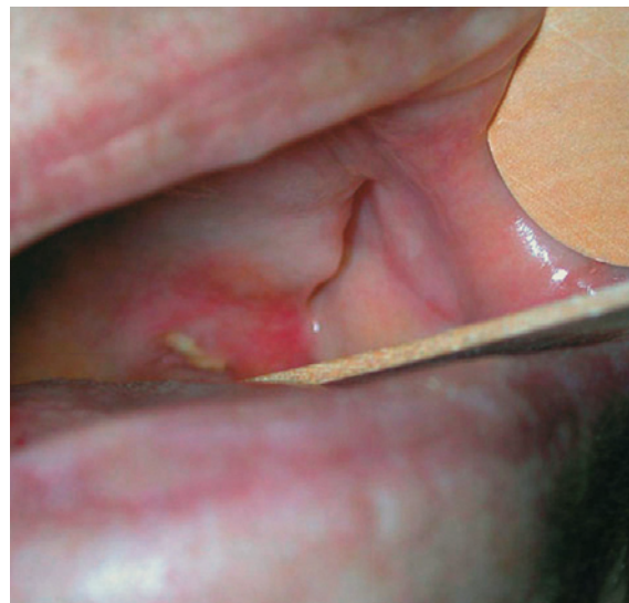
Figure 2 : Ulcération palatine. Palatine ulceration