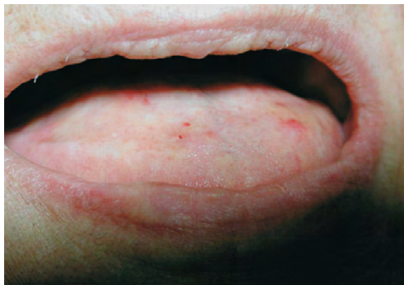
Figure 1 : Face dorsale de la langue. Dorsal side of the tongue

Dans la région postérieure gauche du palais dur, il existe une ulcération mesurant environ 1 cm de diamètre, avec des bords surélevés, rouges et réguliers, avec un fond jaunâtre. Cette lésion est entourée par une zone fortement érythémateuse. La palpation est peu douloureuse ce qui permet de mettre en évidence la dureté de son fond et le caractère acéré de ses bords (Fig. 2). Le diagnostic de séquestre osseux en voie d'élimination est posé. Chez cette patiente de 77 ans, en mauvais